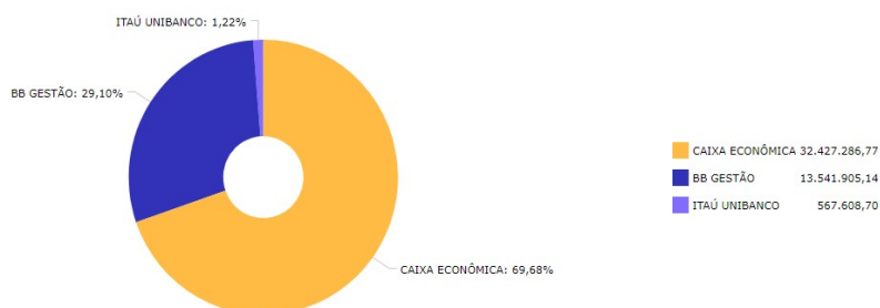
Distribuição dos ativos por Administradores - base (Março / 2020)